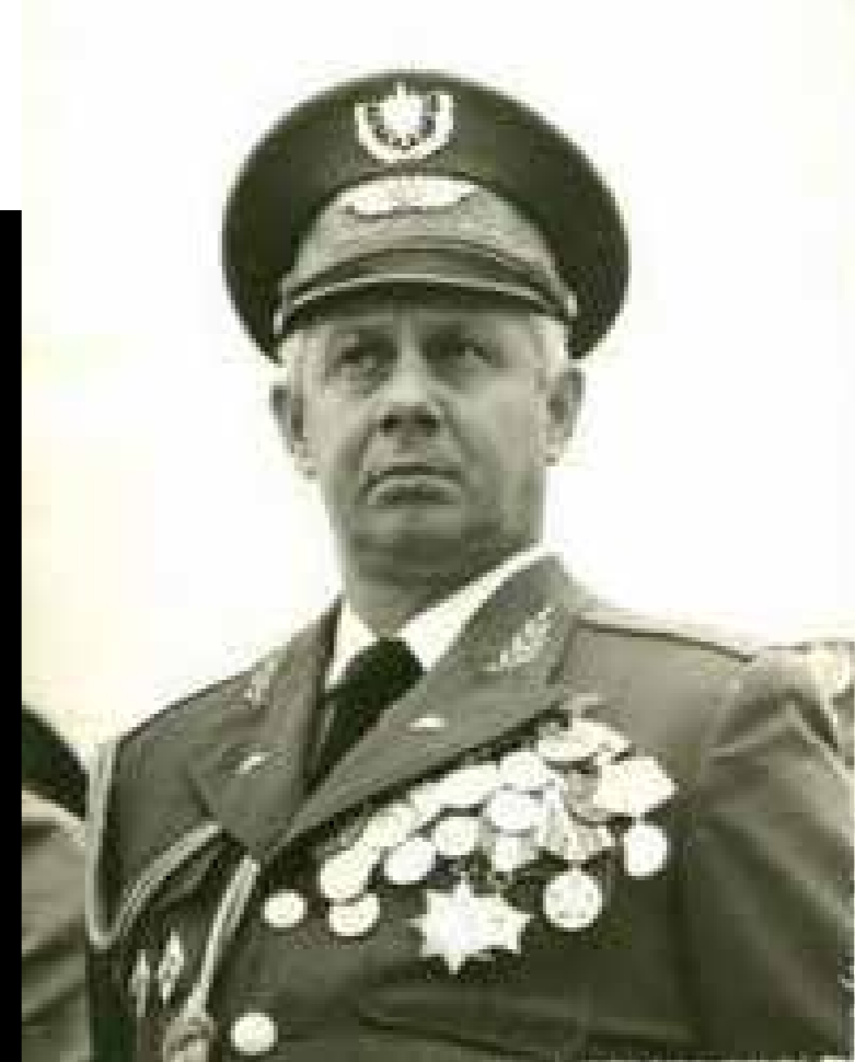
| General Néstor López Cuba.