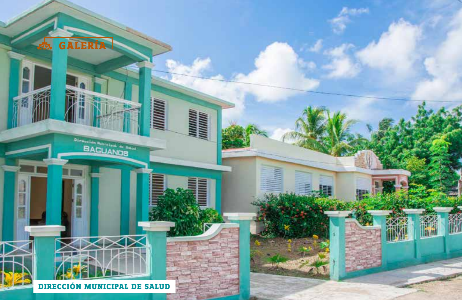
DIRECCIÓN MUNICIPAL DE SALUD