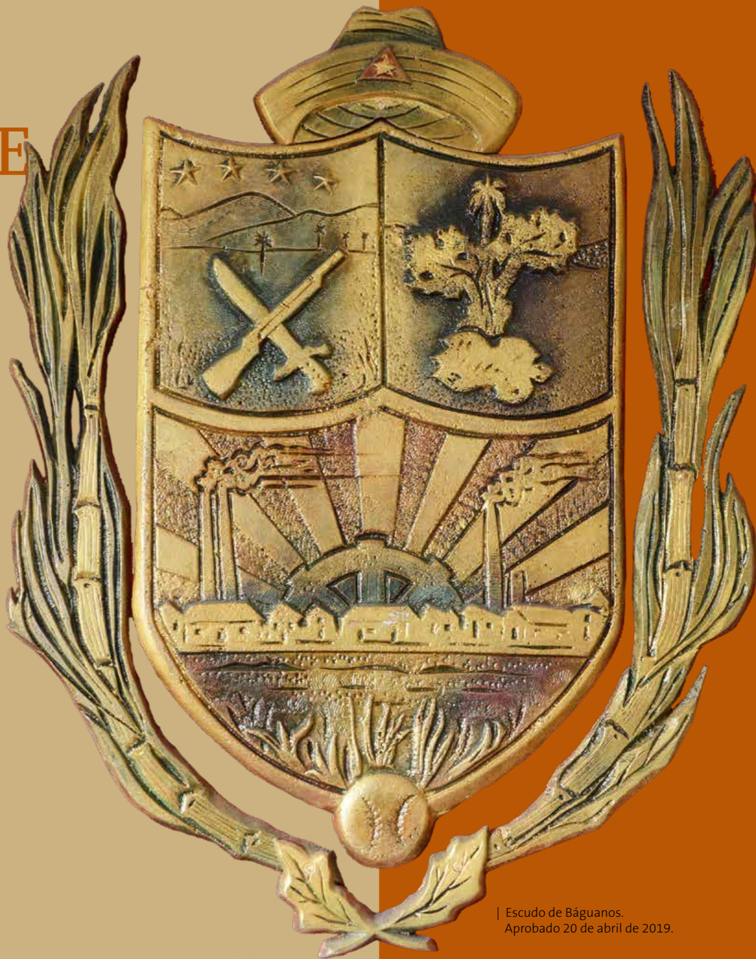
| Escudo de Báguanos. Aprobado 20 de abril de 2019.

Este homenaje a la historia del municipio fue aprobado por la Asamblea Municipal del Poder Popular en reunión efectuada en el local perteneciente al Cine Báguanos, el sábado 20 de abril de 2019. 🇨🇺