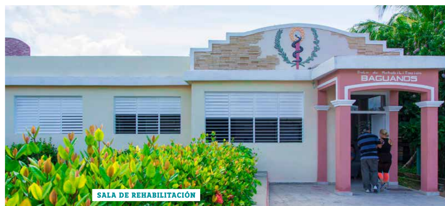
SALA DE REHABILITACIÓN