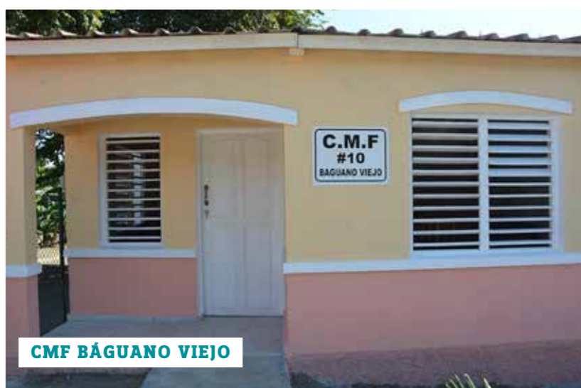
CMF BÁGUANO VIEJO