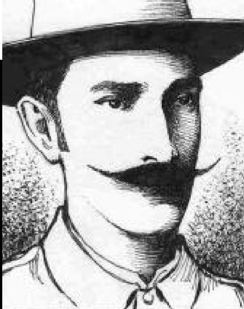
| General Remigio Marrero Álvarez.