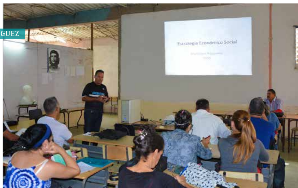
| Nuevas tecnologías como herramientas clave para el proceso de enseñanza-aprendizaje.

Hoy la educación baguanense cuenta con una red escolar de 94 instituciones educativas que van desde la Primera Infancia, hasta la Educación de Adultos. Tiene, además, un Centro Universitario Municipal que, en su relación intersectorial, garan-