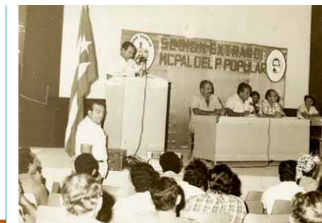
01 SESIÓN EXTRAORDINARIA