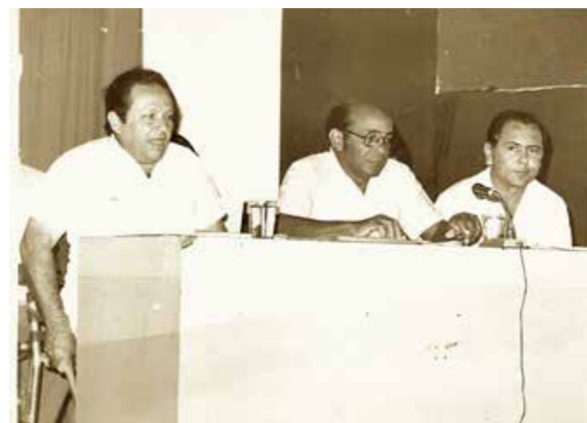
03 I SESIÓN