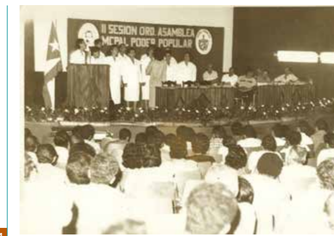
04 II SESIÓN