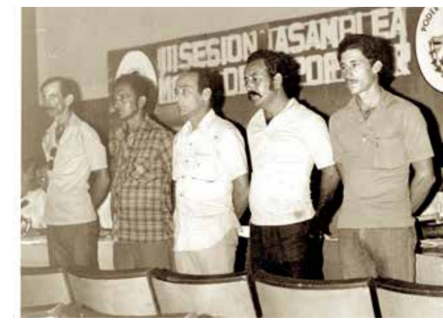
05 III SESIÓN