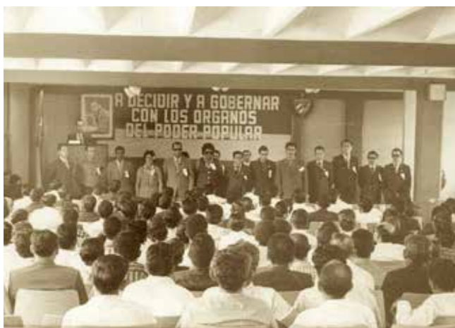
02 PRIMER PERÍODO DE MANDATO