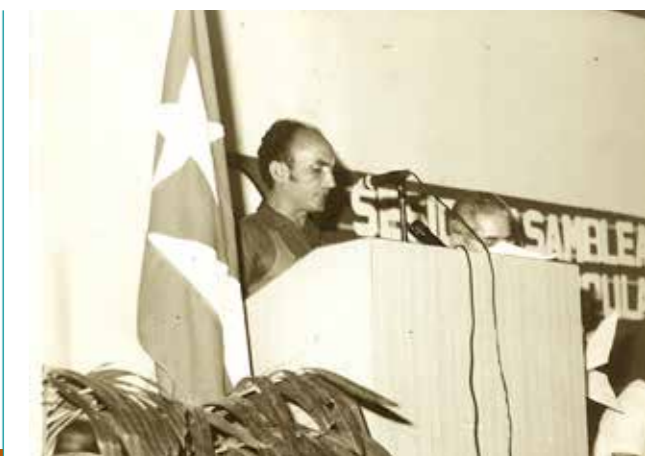
07 V SESIÓN