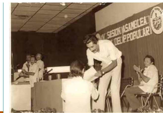
06 IV SESIÓN